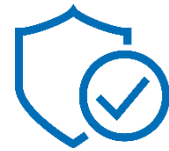
gwk "longlife Heizpatrone"